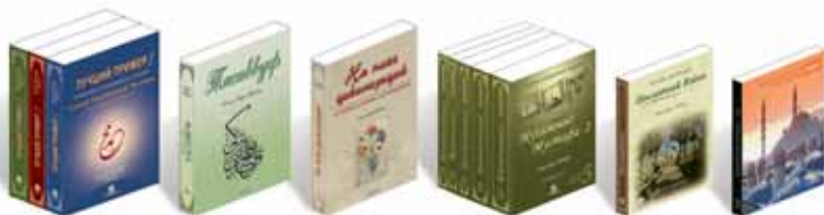
Лучший Прованс - 1, 2, 3