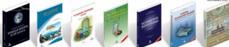
Земная жизнь и 44 Блага