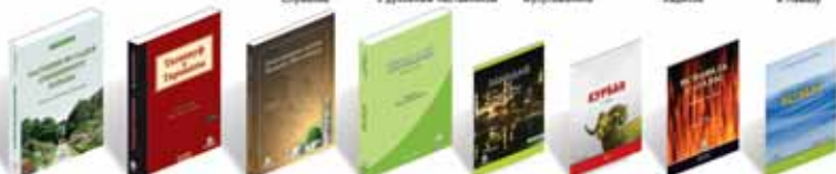
Рассказы из жизни Секретного Корана