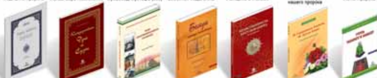
Учить читать Коран